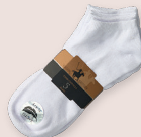
YORKSHIRE POLO CLUB