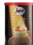
SEGAFREDO ZANETTI EMOZIONI

Por lo anterior, incumplen la Norma Oficial Mexicana de Etiquetado. 6