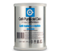
CAFÉ PUNTA DEL CIELO